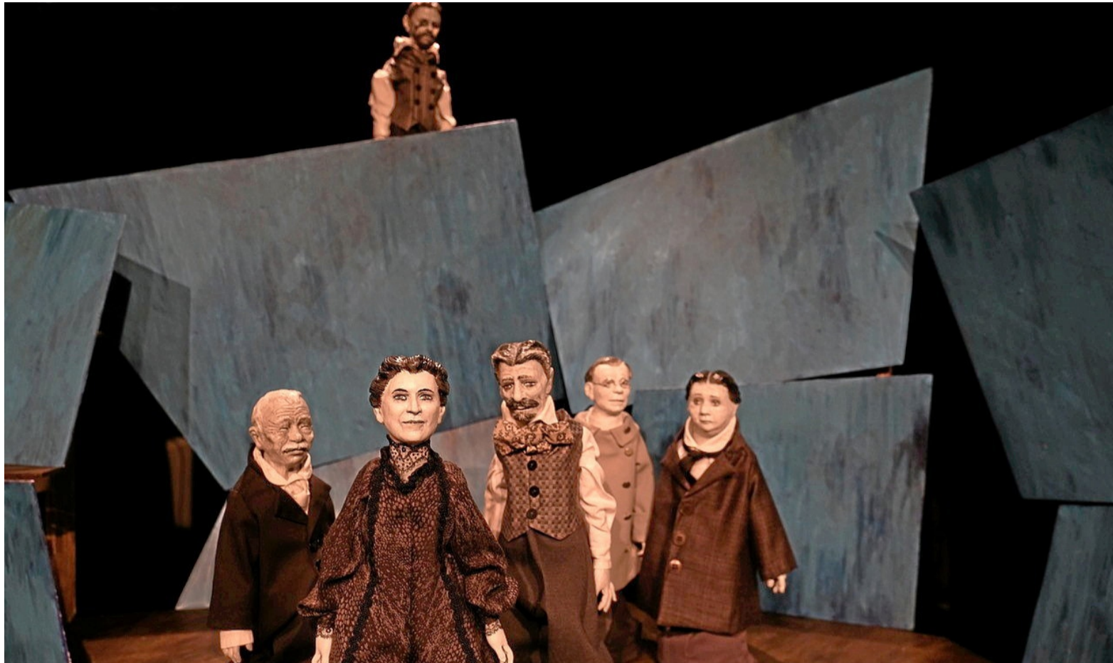
Das historisch anmutende Puppen-Ensemble aus Anton Tschechows Tragikomödie.